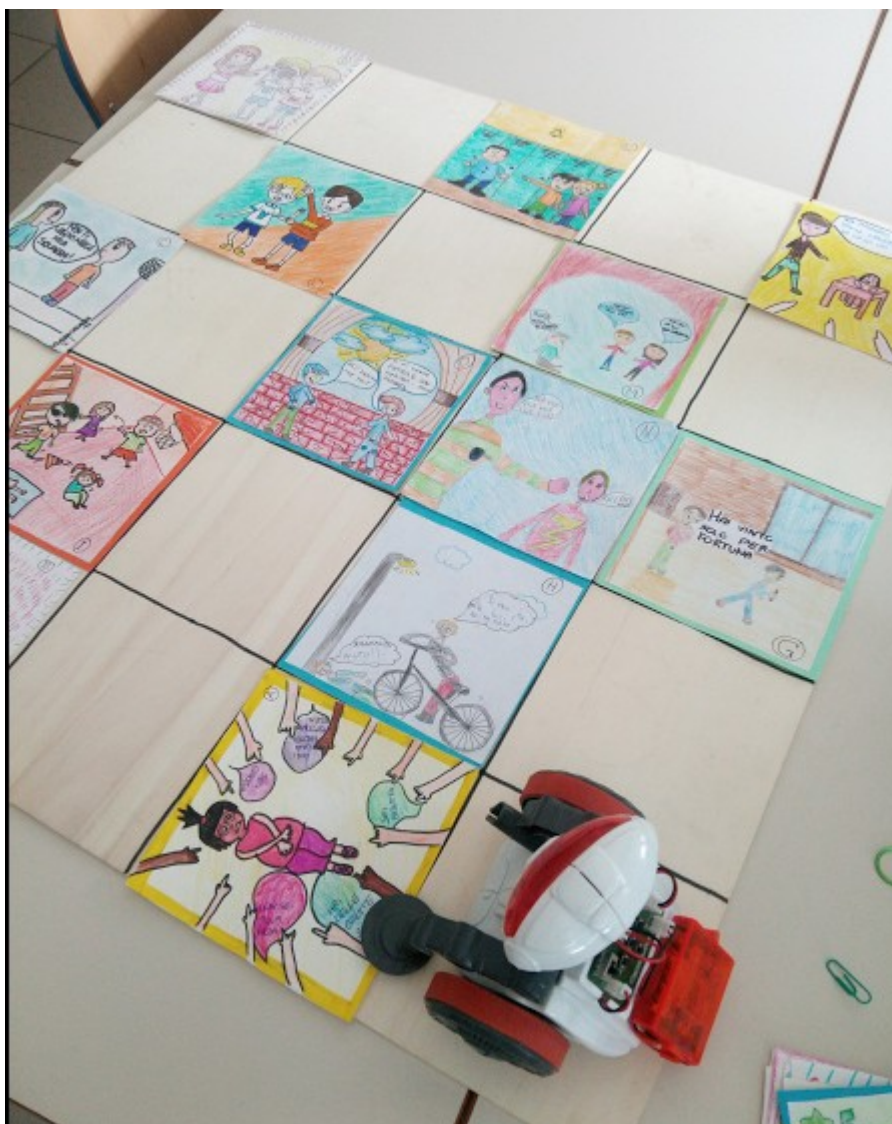
CARTE GRANDI CON SITUAZIONI PROBLEMATICHE

Vince il TITOLO DI BUDDY not BULLY chi per primo fa arrivare il Robot al traguardo.